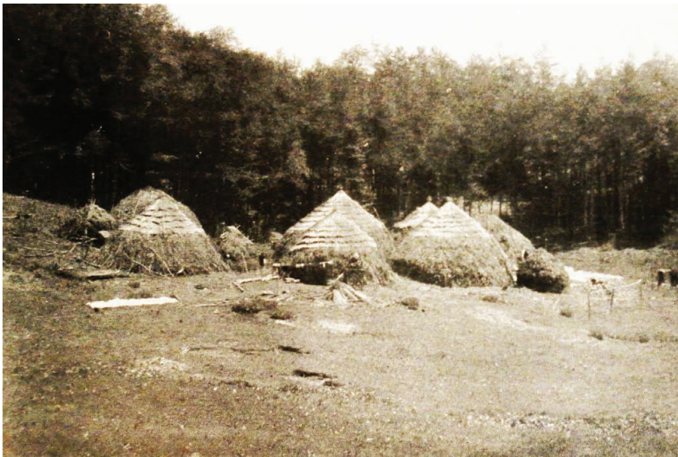
Foto 1.4 Dic Foto në një vendbanim nomad në malin "Guri i Topit" në Gramsh në vitet 1924 - 1928