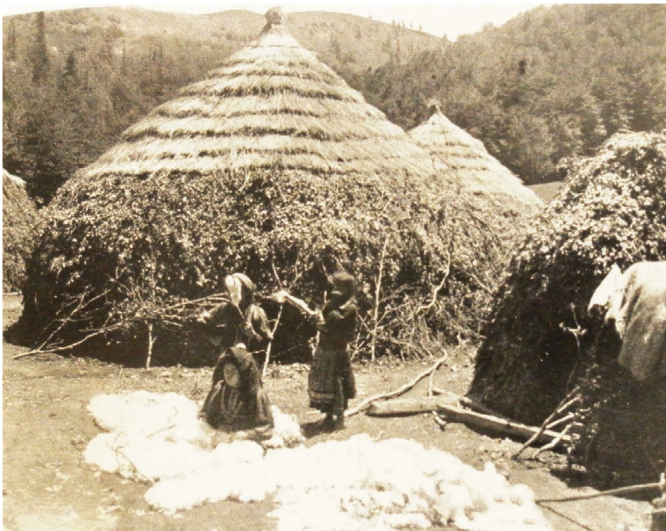
Foto 1.5 Dic Vajzat duke tjerrë leshin në një vendbanim nomad në malin "Guri i Topit" në Gramsh në vitet 1924 - 1928