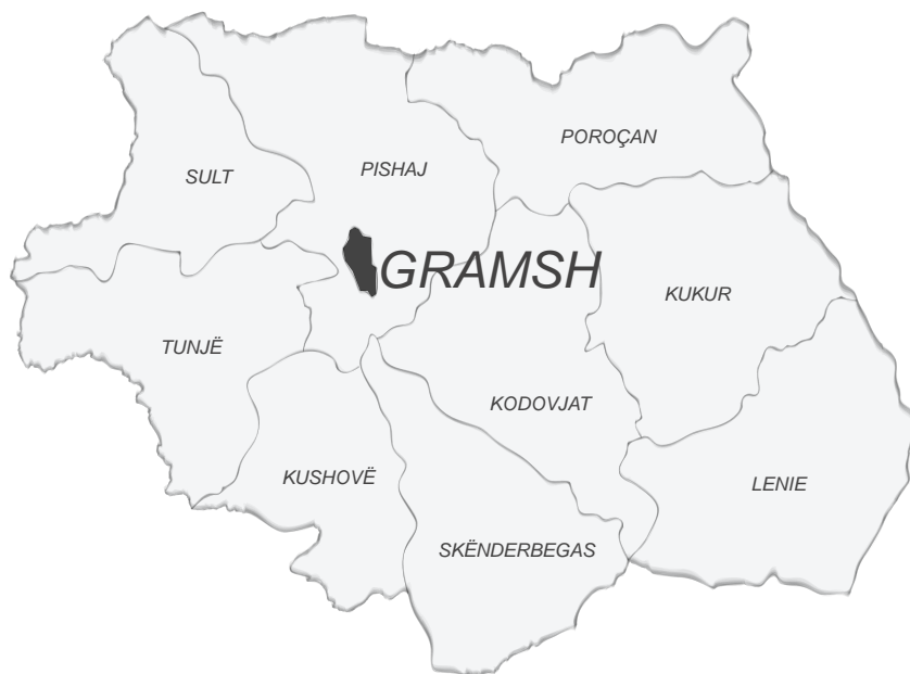
Figura 1.2 Dic Harta e re territoriale e bashkisë Gramsh

Bashkia e Gramshit është vendosur në krahun lindor të lumit Devoll, në terren kodrinor në lartësi 180 deri 230 m mbi nivelin e detit dhe ekziston si qendër banimi rreth 600 vjet më parë në të njëjtin vend. Ajo kufizohet nga bashkitë: Korçë, Pogradec, Berat, Skrapar, dhe Elbasan.