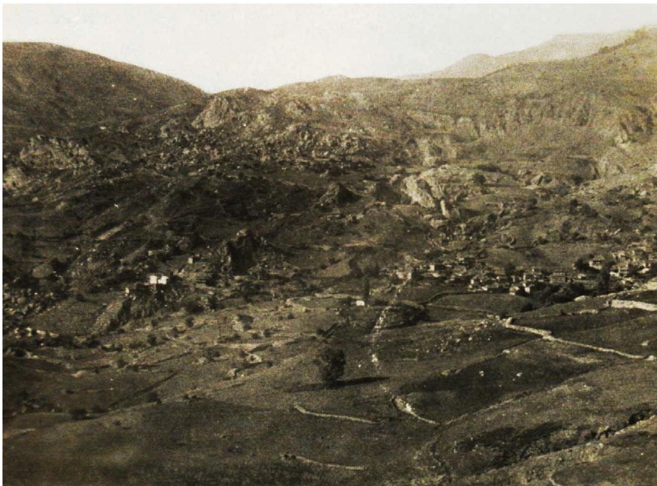
Foto 1.3 Dic Foto e Gramshit fshat

Ishte pozicioni gjeografik dhe vendosja në kryqëzim e disa rrugëve që vinin nga Elbasani, nga Sulova, nga Berati, Tomorrica e nga Korça nëpërmjet luginave, të cilat ndikuan që të rritej rëndësia e kësaj qendre, sidomos në planin administrativ.