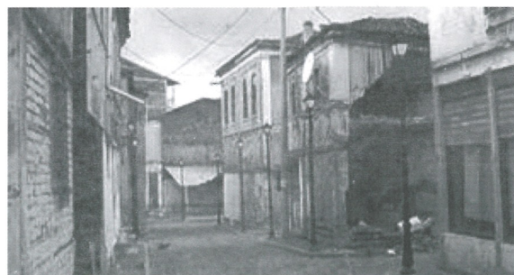
3. Fragment i haneve në Pazarin e Korçës.