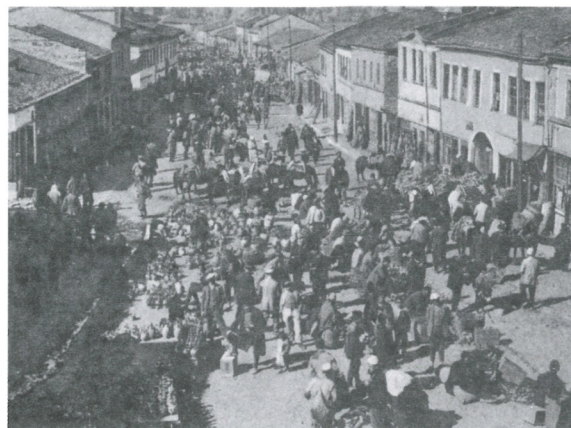
1. Foto të Pazarit të Korçës në periudhën e pushtimit turk

Hanet kanë qenë të pranishme në numër të konsiderueshëm, rreth 16, pavarësisht se sot kanë mbërritur pak prej tyre. Vendosja e tyre në Pazar ka një rregull të caktuar. Zakonisht ato ngriheshin në afërsi të shesheve kryesore të tregtimit, si dhe buzë rrugëve, që të çonin në Pazar. Kështu, rreth Pazarit të Madh në qendër, ndodhet numri më i madh i haneve." (Thomo, 2012, pp. 246, 248)