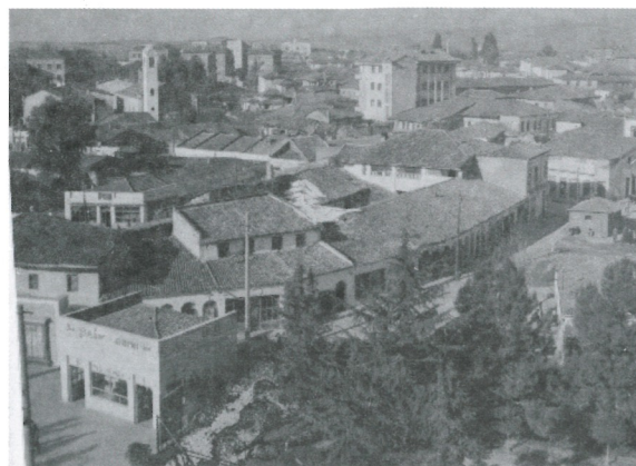
2. Foto e Pazarit të Tiranës.