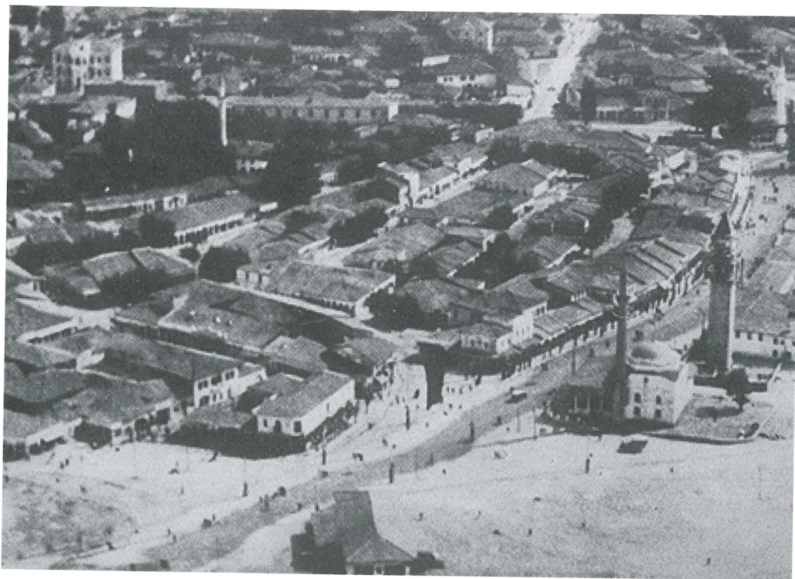
2. Pamje ajrore e pazarit të Tiranës vitet '20, para ndërrhyrjeve